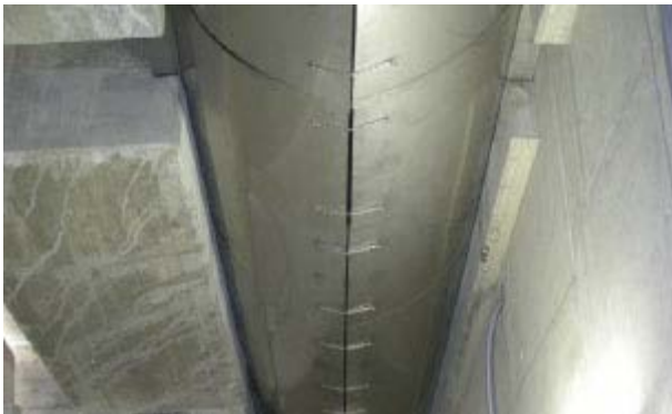
Abb. 1 - Modularer Aufbau des Systems GU-f