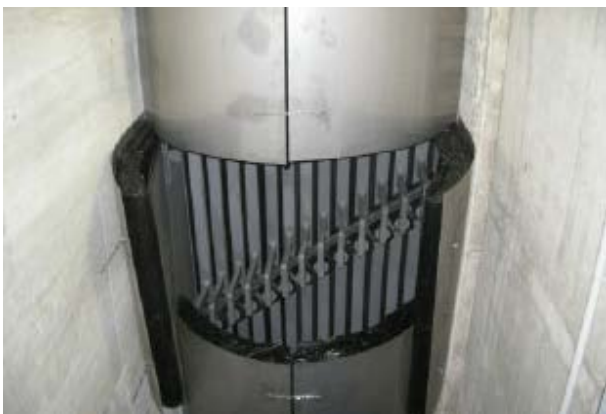
Abb. 2 - lokale, bedienerfreundliche Öffnung des GU-f